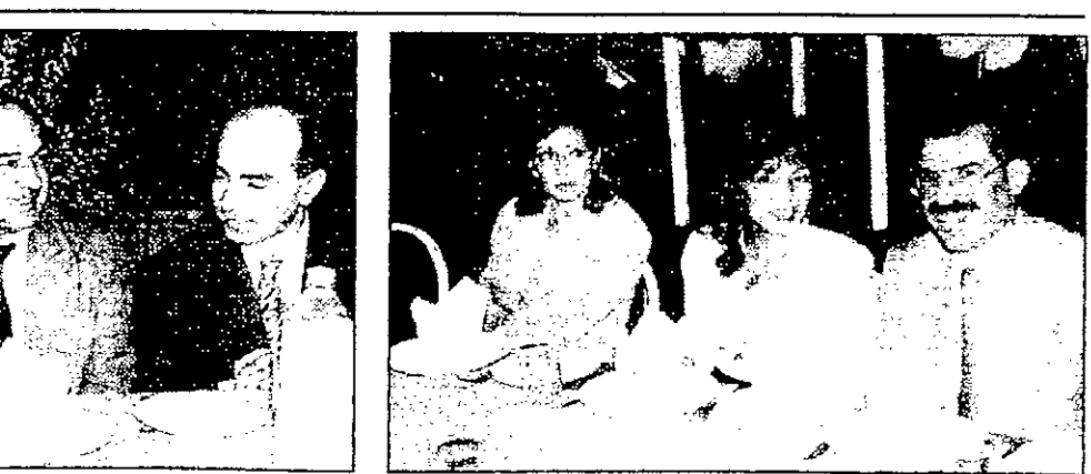
رجال السياحة والسفر